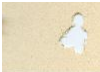
H&N Field Target Trophy 5,0mm