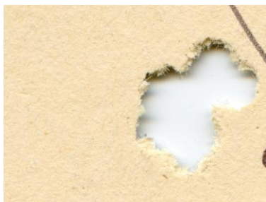
H&N Baracuda 5,0mm