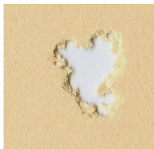
H&N Baracuda 5,5mm