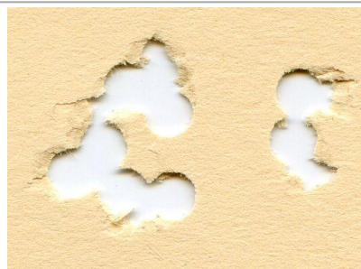
H&N Crow Magnum 5,5mm