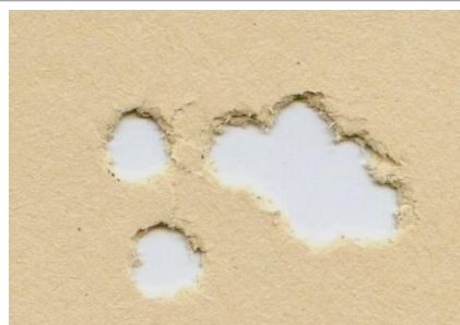
H&N Field Target Trophy 6,35mm