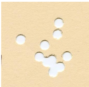
H&N Hollow Point 5,5mm