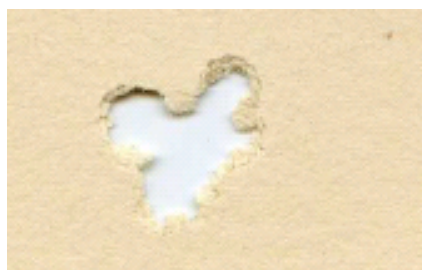
H&N Baracuda 4,5mm