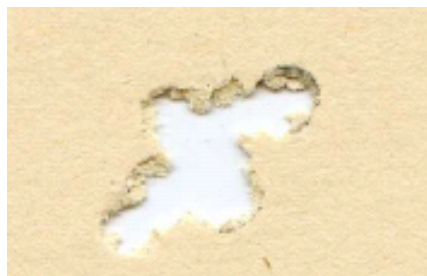
H&N Baracuda Power 4,5mm