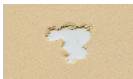
H&N Field Target Trophy 5,5mm