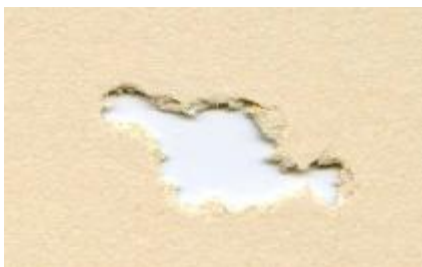
H&N Field Target Trophy Power 4,5mm